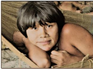
SECOYA – PROGRAMME D'ÉDUCATION À LA SANTÉ

le trentième anniversaire de la Convention des Nations Unies relative aux droits de l'enfant, en particulier l'Art. 24 .